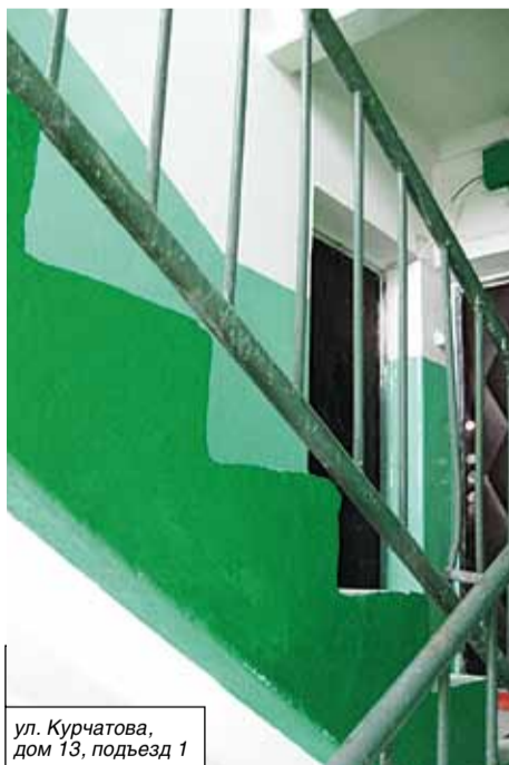
ул. Курчатова, дом 13, подъезд 1

– За помощь спасибо. Без нее мы бы не справились. Дому полвека. В нашем подъезде живут в основном очень пожилые люди. Среди них – ветераны войны. Одной из них 92 года, другому – 87. Есть ветераны атомной станции. Ни физически, ни материально они не в состоянии заниматься наведением в доме порядка. Поэтому они особенно благодарны за внимание и заботу. Двери нам поставили. Ремонт в подъезде заканчивается. Краску выбрали по нашей просьбе нежно зеленую. Светло и чисто. Почтовые ящики уже закуплены и привезены. Осталось повесить на место.