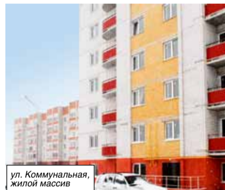
ул. Коммунальная, жилой массив

На Набережной, 28 Б, 34 и 44 будут заменены почтовые ящики. В доме 44 и 46 необходимо восстановить системы отопления в подъездах. Жители дома 35 Б по улице Космонавтов просят решить вопрос об организации детской игровой площадки.