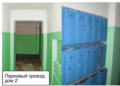
Парковый проезд, дом 2

Сделан ремонт в подъезде дома 2 по Парковому проезду. Работы велись под контролем общественности. По улицам Победы, 2, в подъезде 1 и Первомайской, 3 в подъездах 4 и 5 заменены входные двери и установлены домофоны.