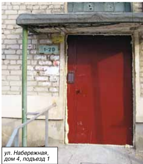
ул. Набережная, дом 4, подъезд 1

Космонавтов будут установлены козырьки над подъездами и доводчик на подъездную дверь в доме 17.