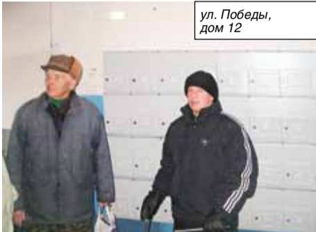
ул. Победы, дом 12

– Удалось, на мой взгляд, сделать немало. В доме 10 по улице Победы – косметический ремонт 1-х этажей подъездов с заменой почтовых ящиков и ревизией входных дверей (6 подъездов). В доме 12 по этой же улице ремонт был выполнен на всех 12 этажах подъезда, включая переходы между этажами и установку почтовых ящиков. На Победы, 14 и Первомайской, 9 тоже сделан косметический ремонт 1-го этажа подъезда с заменой почтовых ящиков а также ревизия электропроводки и освещения на 1-х этажах.