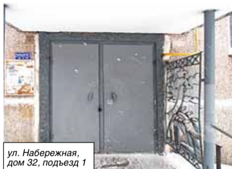
ул. Набережная, дом 32, подъезд 1

Совместно с жильцами направлено обращение в УК «Новый Дом» с просьбой произвести ремонт в подъезде №1 по ул. Космонавтов 19 А (подъезд пострадал от пожара), только после вмешательства Главы города и работы СТ №5, был произведен внеплановый ремонт подъезда.