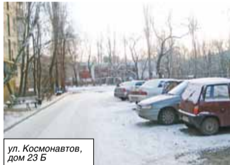
ул. Космонавтов, дом 23 Б

Двор дома 28 по Набережной, где начаты работы по приведению в порядок дворовой территории, включен в муниципальную программу благоустройства на 2012 год. В этом же году будет заменен линолеум во всех шести подъездах дома 23 Б по улице Космонавтов. Стоимость работ свыше 300 тысяч рублей.