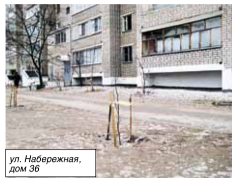
ул. Набережная, дом 36

– Организовано место для сбора ТБО, в соответствии с требованиями СанПИНа для жителей домов 28 Б и 34 по улице Набережная. На территории дома 36 проведено озеленение. Инициирован перерасчет оплаты за отопление (октябрь 2011 года). Дворовая территория домов 28 Б и 34 по Набережной включена в план городского благоустройства в рамках подготовки территории города к празднованию 55-летия города.