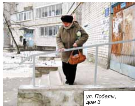
ул. Победы, дом 3