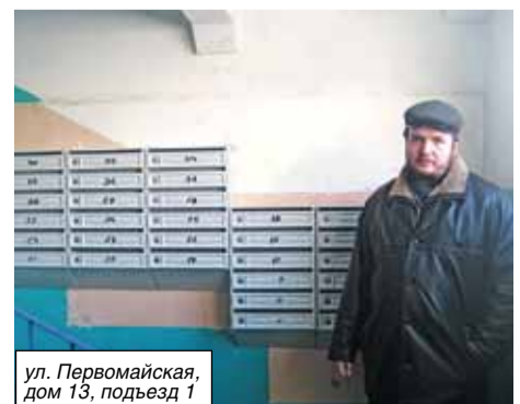
ул. Первомайская, дом 13, подъезд 1

Даже для малых дел есть большие планы. Но никакой судьбы у атомных городов без развития предприятий не существует, а оно возможно только в том случае, если будет сохранена господдержка. Сейчас она есть. Надо наращивать объемы и подтягивать за собой город.